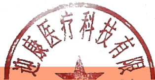
报价清单一览表(货物)