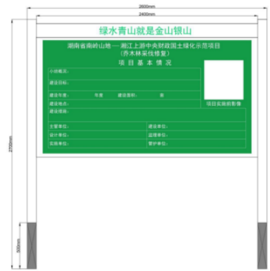
图 7-3 乔木林采伐修复标识牌示意图