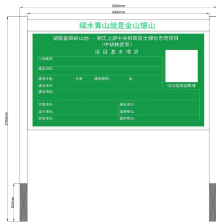
图 7-2 中幼林抚育标识牌示意图