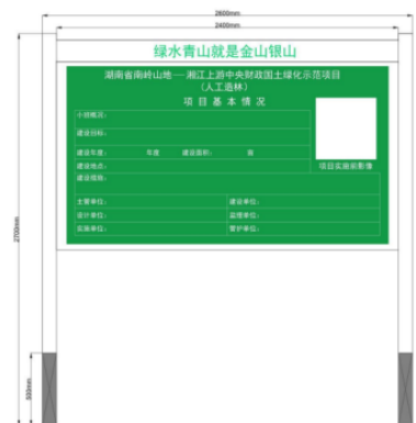
图 7-5 人工造林标识牌示意图