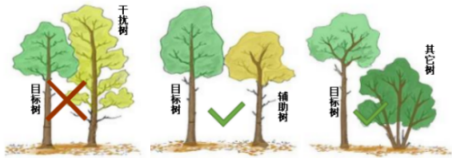
图 4-1 林木分类示意图