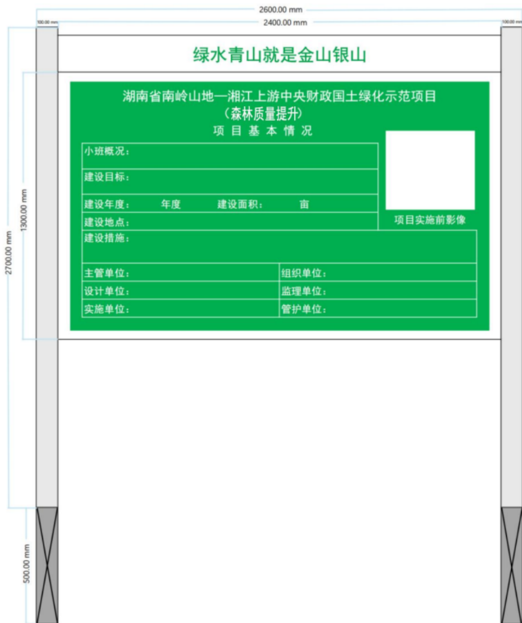
图 7-2 标识牌示意图